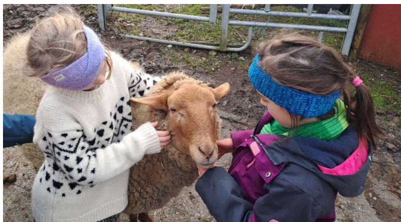
Besuch bei den Schafen im Dezember 2023