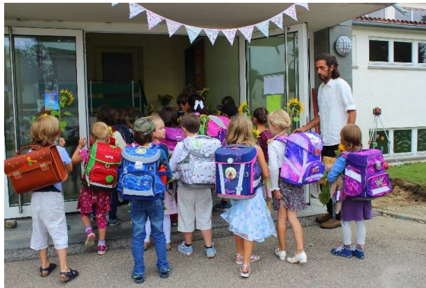
Die stolzen Schüler auf dem Weg in die allererste Schulstunde