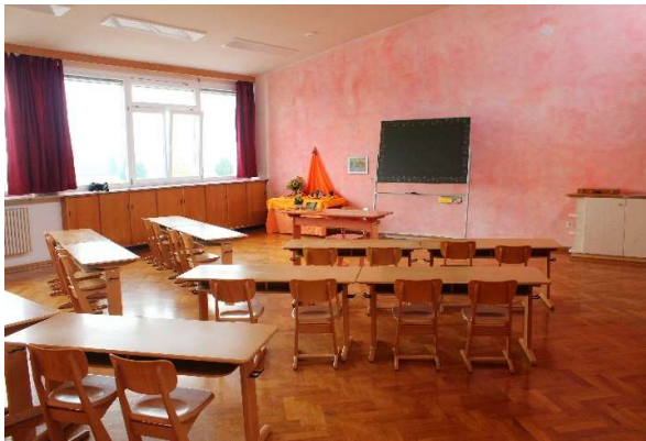
Das Klassenzimmer der Klasse 1 und 2 im Schuljahr 23/24