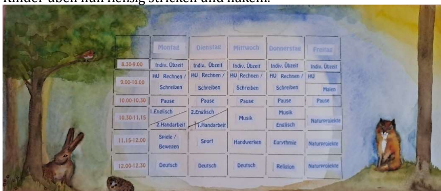
Stundenplan der jetzigen Klasse 1 und 2

Im Fach Handarbeit wurde der Weg vom Schaf zum Wollfaden verfolgt und die Kinder üben nun fleißig stricken und häkeln.