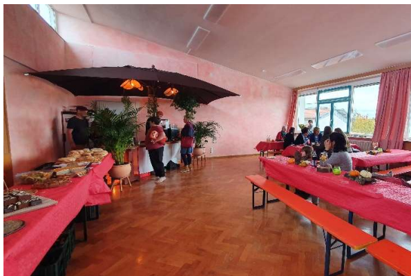
Das von den Eltern liebevoll gestaltete und professionell geführte Café am Tag der offenen Tür